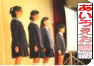
ダンス「ようかい仲間」