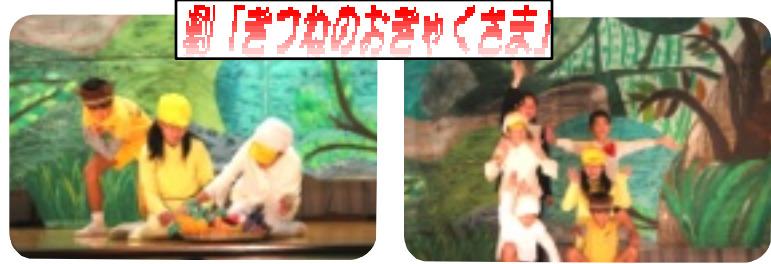
劇「きつねのおきゃくさま」