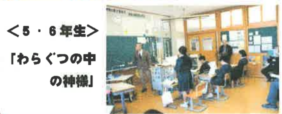
<5・6年生> 「わらくつの中の神様」