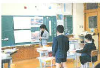
<3・4年生> 「アップとルーズで伝える」

今回の授業では、中学年は説明文を、高学年は物語文を扱いました。文中の一つ一つの言葉に注目しながら、筆者の考えや場面の様子などを考えました。少しずつではありますが、子どもたちに力が付いてきています。